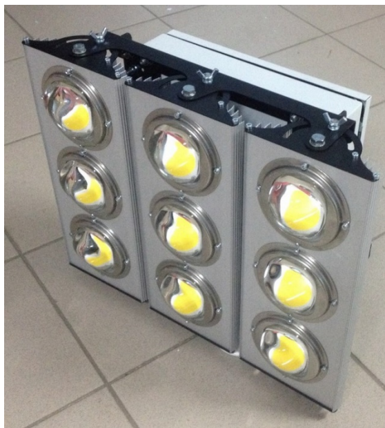
Рисунок 1 – Внешний вид изделия.

Результаты испытаний по настоящему протоколу относятся только к испытанным образцам. Настоящий протокол запрещается частично воспроизводить без письменного разрешения испытательной лаборатории.