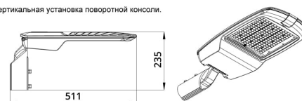
Угол регулировки поворотной консоли \pm 15^\circ с шагом 5^\circ .