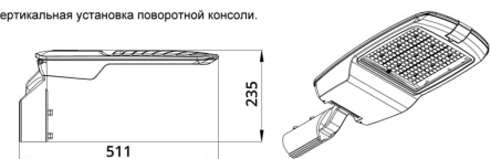
Угол регулировки поворотной консоли \pm 15^\circ с шагом 5^\circ .