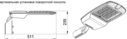
Угол регулировки поворотной консоли \pm 15^\circ с шагом 5^\circ .