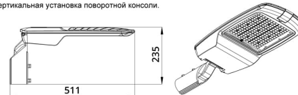
Угол регулировки поворотной консоли \pm 15^\circ с шагом 5^\circ .